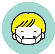
スタッフの マスク着用