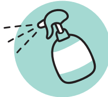
客様に触れる道具や 場所の消毒徹底