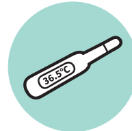
体調管理 検温徹底