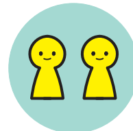
入店・予約 人数制限

その他、政府で発表されている対策に基づき、 安心・安全にご来店いただけるよう努めて参ります。